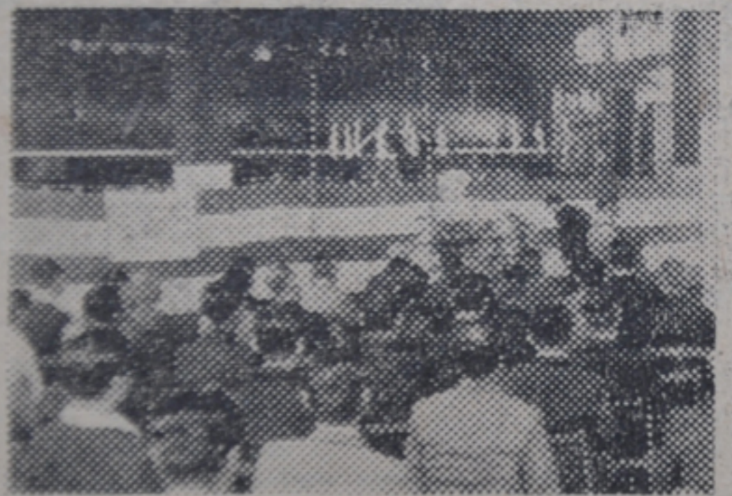
小樽築港機関区では十五日午前十時(写真は築港機関区三十周年記念式)

つづき祝賀会が催され同区は大正十三年十和二年七月十五日完機関庫および手宮で開区されたもの、機関車の一日にとも開区当時の二倍四十名、一万一千三三三となり、配置道線電化にもなつた。され、函館―小樽間のード・アップに大きしている特急用のC62型じめ貨物列車用のDなど合計五十一両で大きな機関区とな