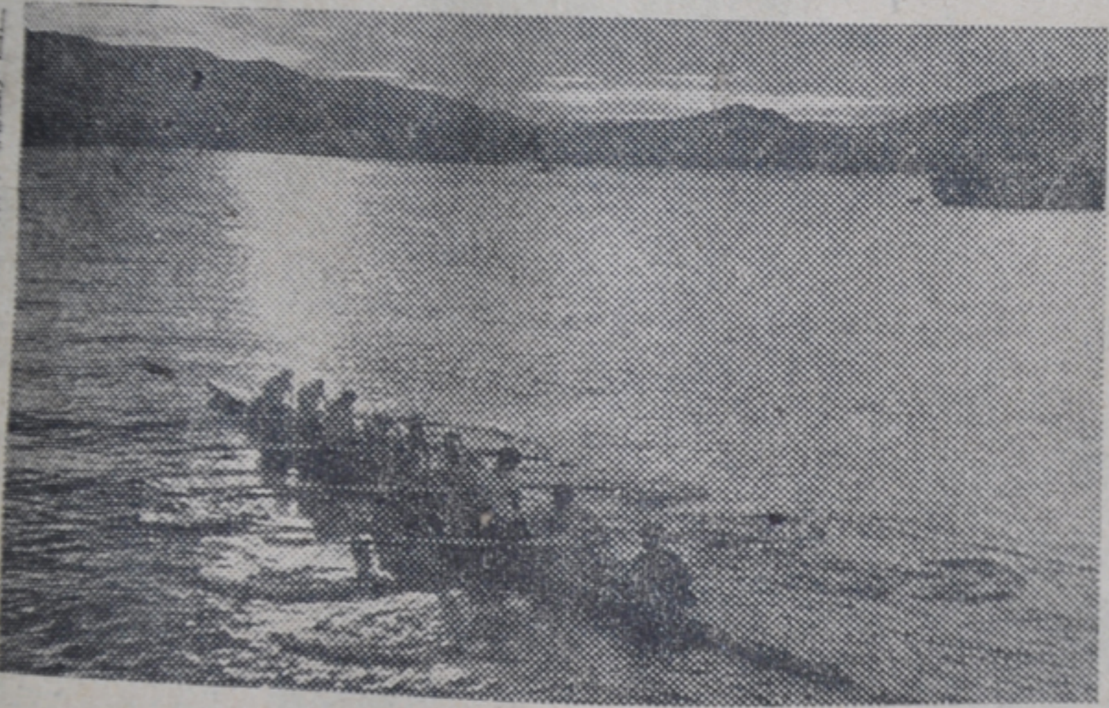
山口(監照)