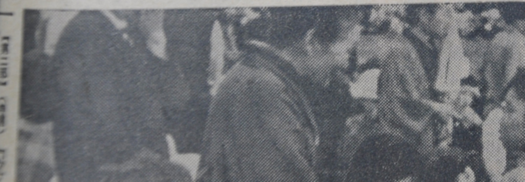
【第三部】(特選) 『二人』 8、100分の1秒、ネオパンSS 単純なのだが、その中に捨てが 素直なよさ、あふれる清純感、