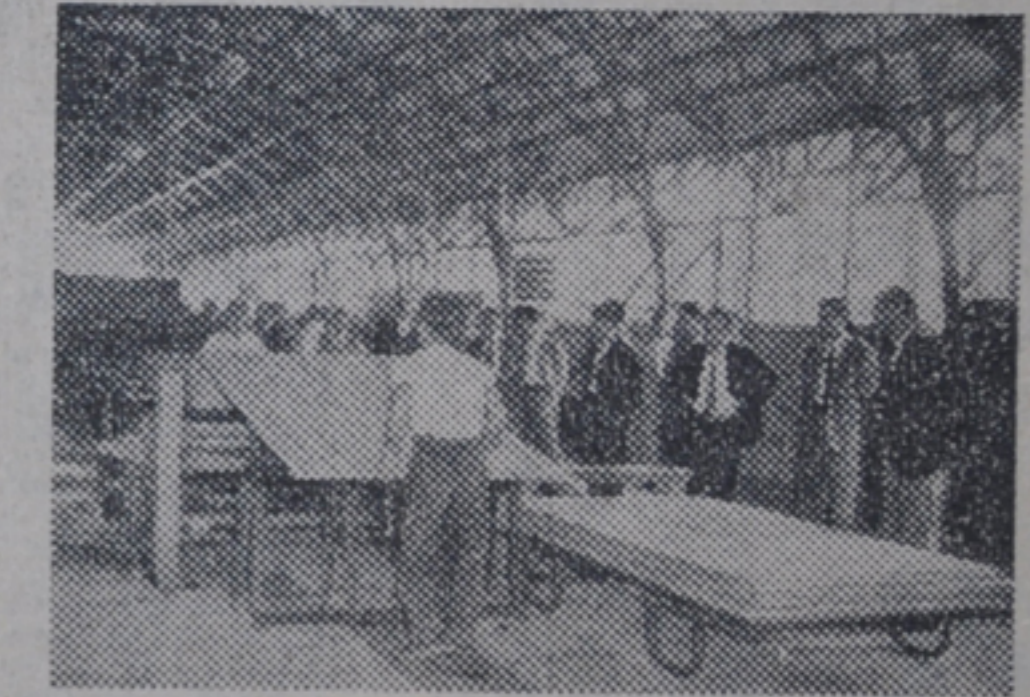
(写真は新工場を見学する人たち)

新宮商行では四日から鋳造工場にレイボード工場一むねの建設をしていたが、このほど完成したので九日午後一時から落成式をあげた。