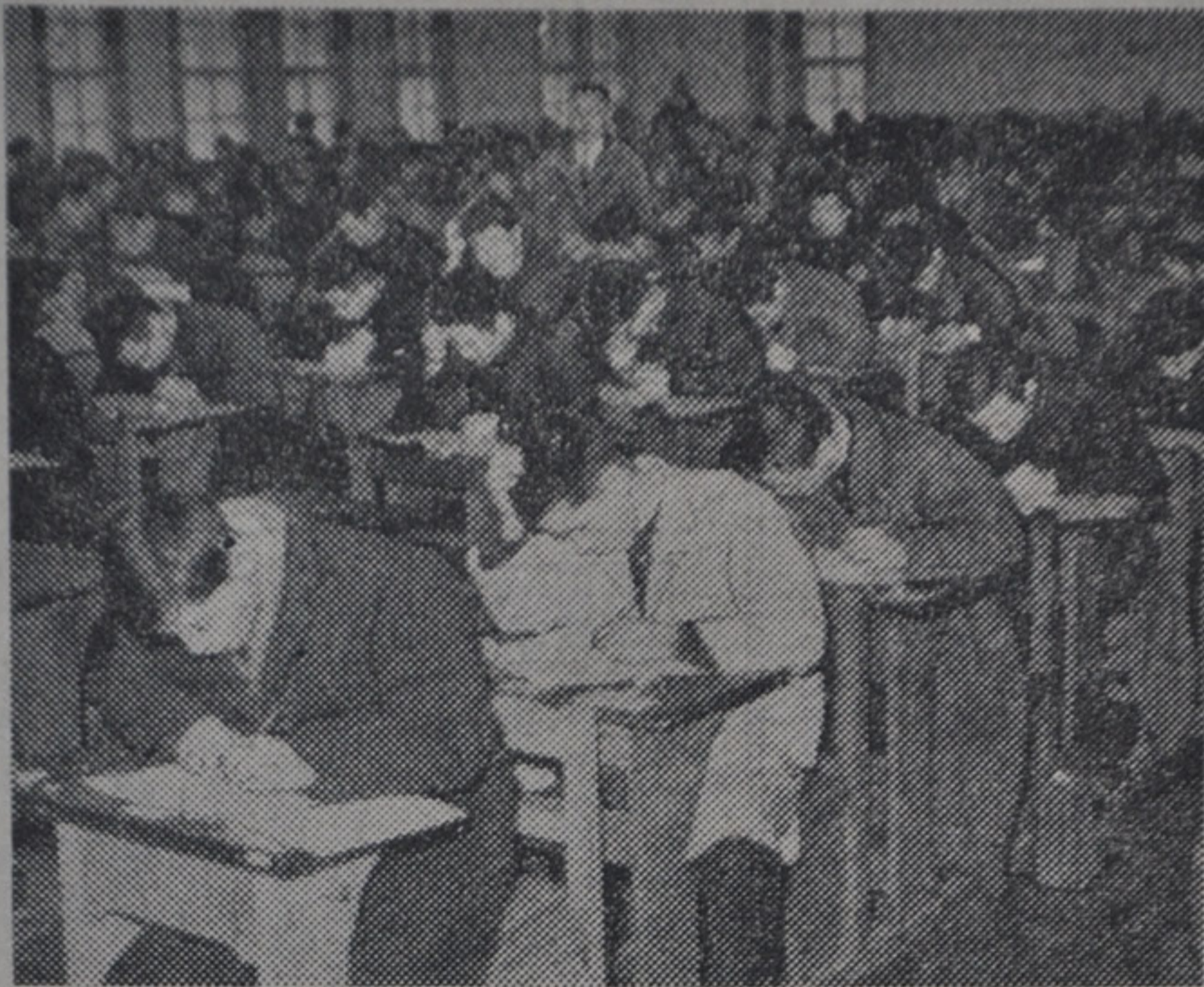
難問と取組む小樽商大受験生—商大大講堂で