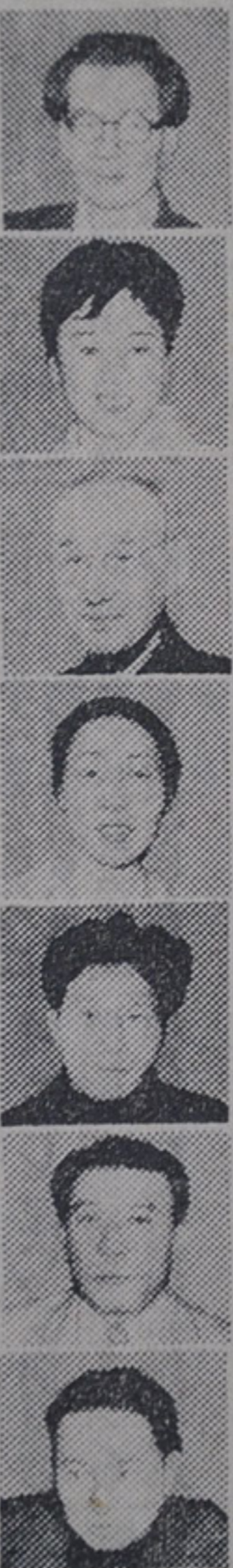
田中千禾夫氏 水木 洋子氏 杵屋 栄二氏 橋 秋子氏 安岡章太郎氏 山口 薫氏 土門 拳氏 橋岡久太郎氏