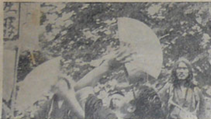
ながながと応援状を読み上げる北大応援団長、二十分以上もある巻き紙を持つのに四人がかり、内容より紙の長さを競い合う?