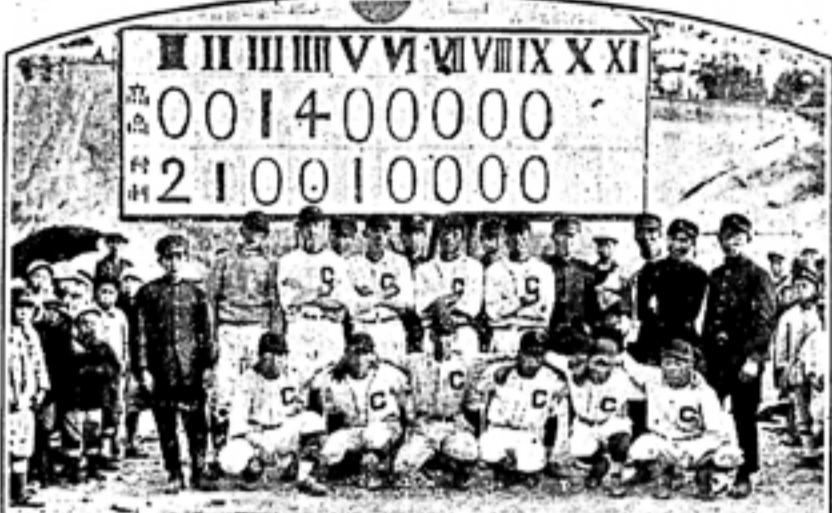
君木、一ノ木、下井、保藤、田中、菅野、阿部、若林、若山、若尾、若菜、若木、若松、若杉、若菜、若木、若松、若杉