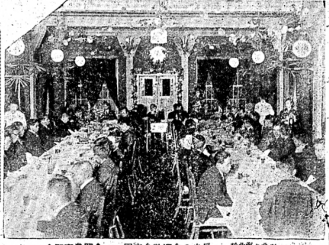
同窓會歓迎會の光景