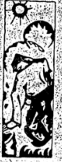
逝さし人々を偲びて