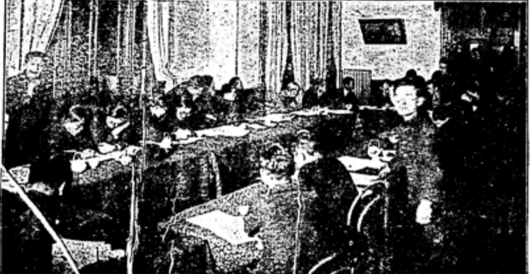
上圖は校友會各部の豫算會議(理事會)

卒業式當日配布のアルバムに関する詳細情報。卒業式當日配布のアルバムに関する詳細情報。