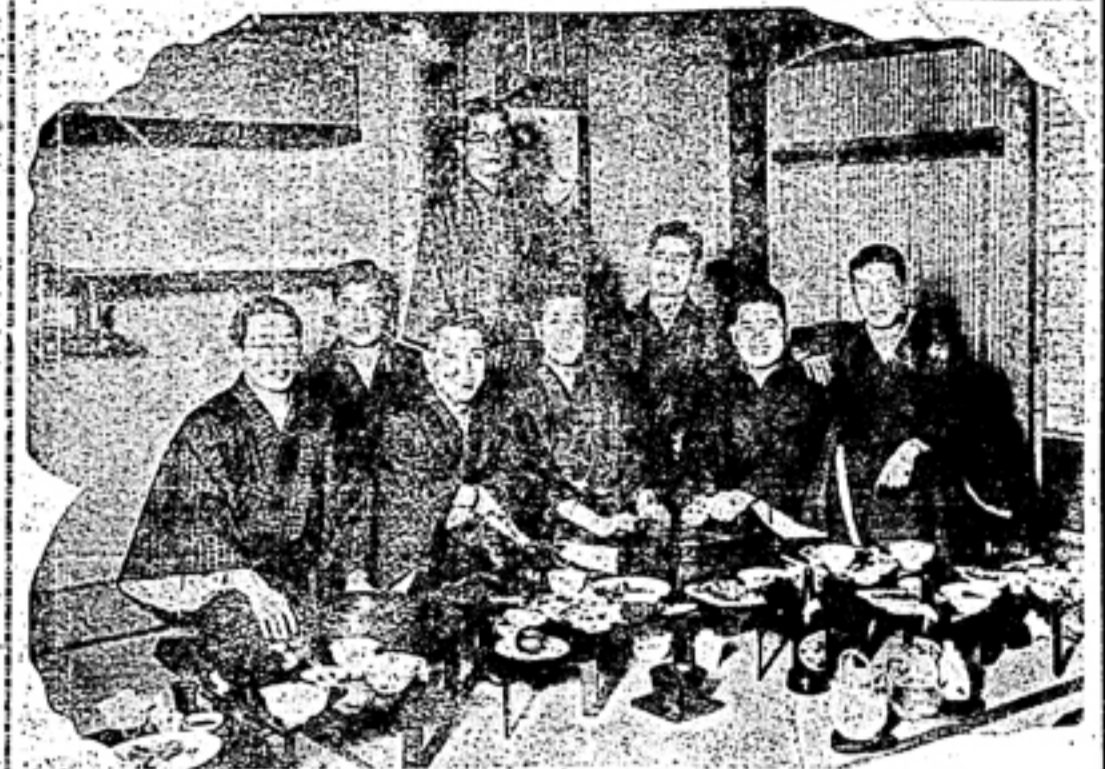
同窓會費 受領報告 (中略) 氏名は左の如し

同窓會費 受領報告 同窓會費の受領報告は、先般の同窓會に出席した方々から、お礼の言葉を頂戴致しました。誠にありがとうございました。