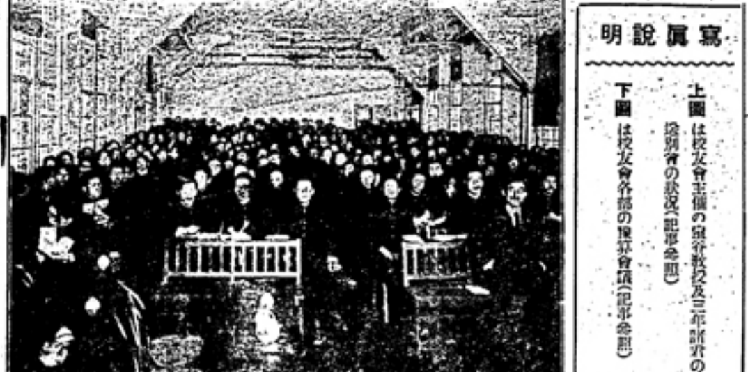
上圖は校友會主催の演習教室及三年生諸君の 下圖は校友會各部の豫算會議(理事會)