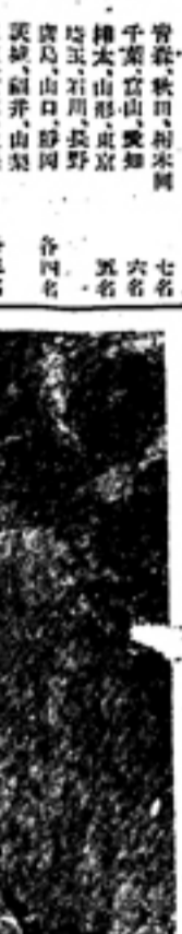
ANTAUENIRU 一九二〇年の春である 魂の窮道を走らせて 鐵路は何處へ走る

ANTAUENIRU 一九二〇年の春である。魂の窮道を走らせて。鐵路は何處へ走る。ANTAUENIRU 一九二〇年の春である。魂の窮道を走らせて。鐵路は何處へ走る。