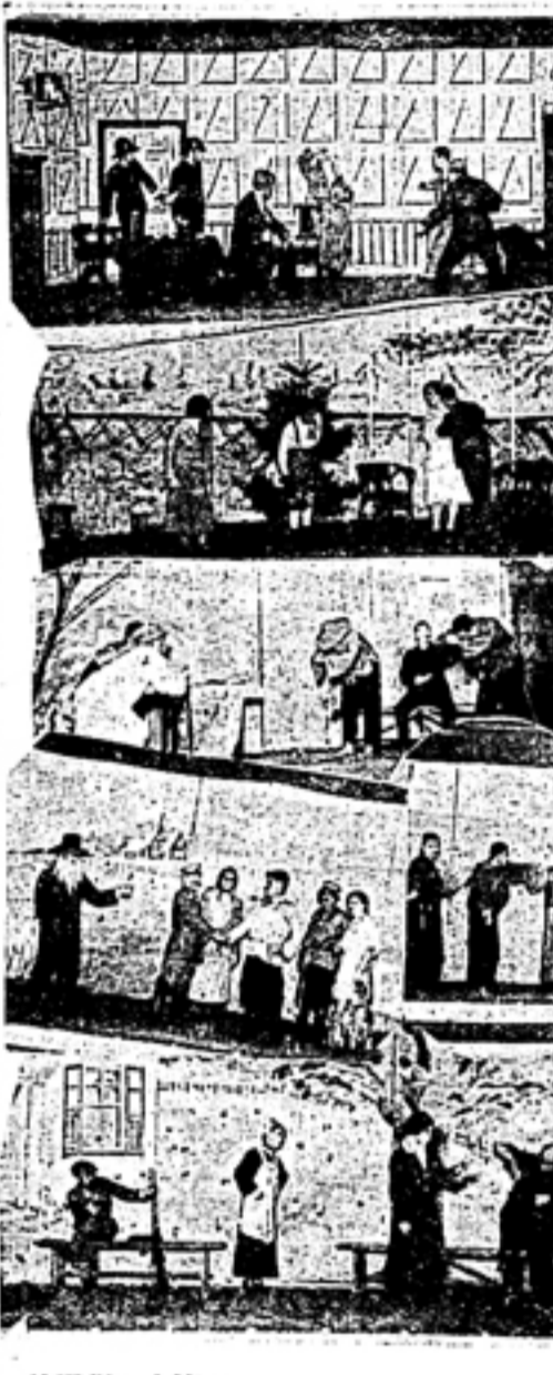
外語劇の上演 上より 英語・獨語・支語(右下迄) 露語・佛語の各演山