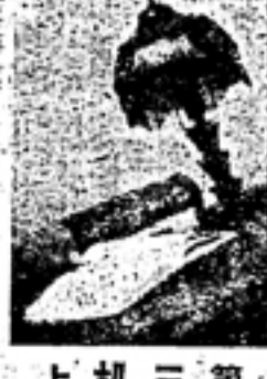
上机三第 授三亮南

人為的対策の具体的な内容として、まず、人為的対策の重要性を述べ、次に、人為的対策の具体的な内容について述べる。人為的対策の重要性は、自然災害による飢饉を軽減し、人命を救済することにある。人為的対策の具体的な内容としては、食糧の増産、食糧の分配、食糧の貯蔵、食糧の輸送などが挙げられる。