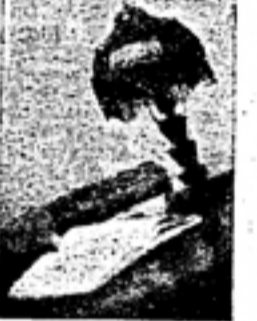
上机三第 南三亮 郎