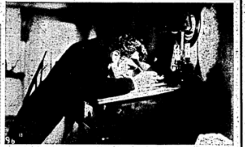
供授事向和東 ◆樂響交成未完◆