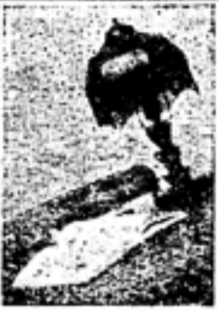
上机三第 [21] 郎三亮南