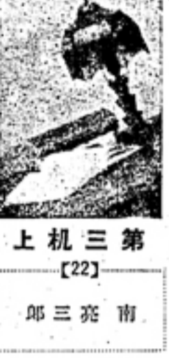
上机三第 [22] 郎三亮南