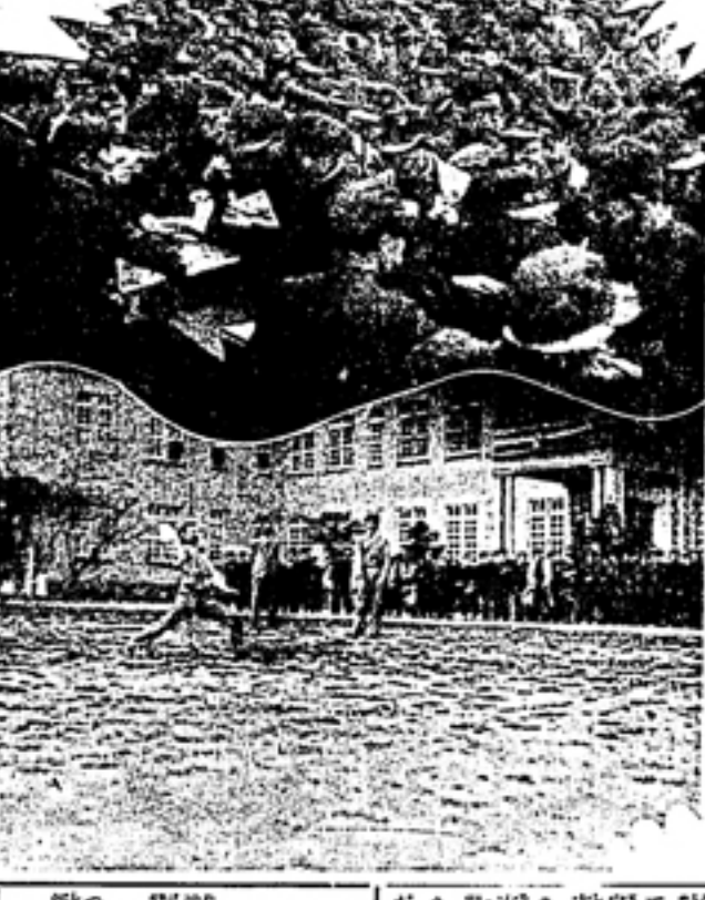
新入生歓迎会の様子

新しき學人を迎へ、清新の氣、學園に横溢。本學園は、新入生を迎え、清新の氣、學園に横溢。本學園は、新入生を迎え、清新の氣、學園に横溢。本學園は、新入生を迎え、清新の氣、學園に横溢。