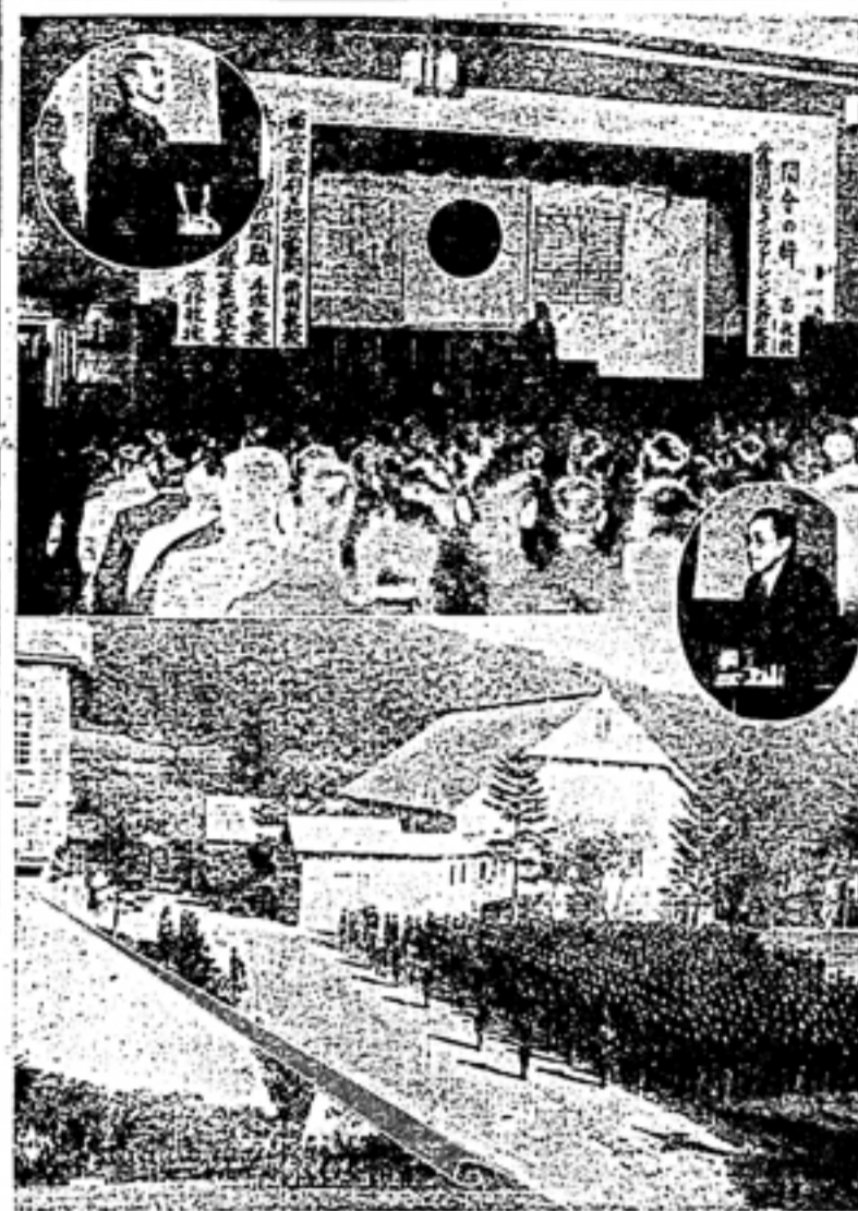
本校の最新ニュースや、教職員及び生徒の活動について、お知らせいたします。