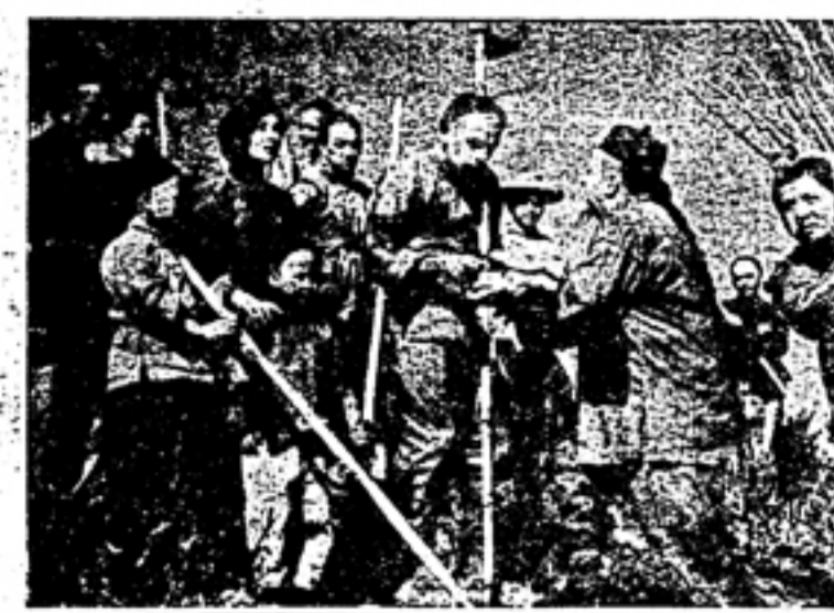
大地 原作 パル・ボッサ