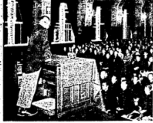
行幸記念講演會の様子

行幸記念講演會は、十月九日、市議事堂に盛大に開催された。講演者は、本校の名誉教授であり、戦時下の教育について豊富な知識と経験を持つ方である。講演内容は、戦時下の教育の現状、戦後教育の展望、そして教育者の使命について詳しく述べられた。講演は、参加者全員が熱心に聴き、多くの質問も出された。