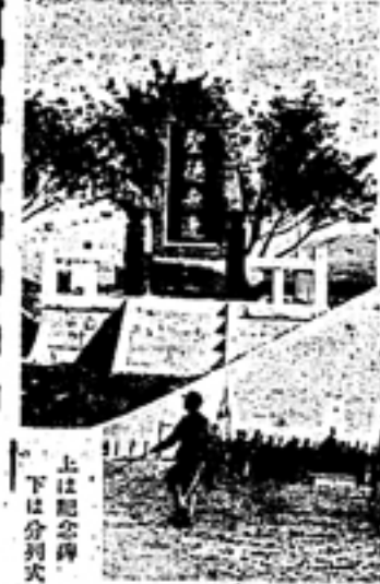
行幸記念式典の厳肅な様子

十月九日、本校に於ける行幸記念式典は、厳肅な雰囲気の中で行われた。式典には、本校の教職員、学生、および関係者約五百名が参加した。式典は、まず行幸記念碑の除幕式から始まり、校長の訓詞、行幸記念式典の意義についての講話、そして行幸記念歌の斉唱で締めくくられた。式典は、参加者全員が感動を覚えるほどの厳肅な雰囲気の中で進められた。