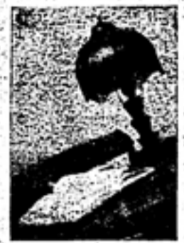
山南 (2) 三亮 郎三