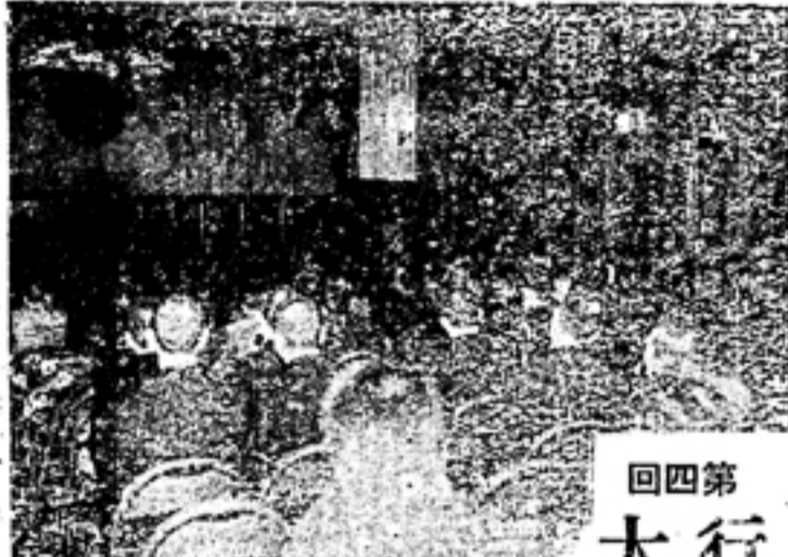
行幸記念大講演會 行幸記念大講演會の様子。講師は、本校校長である。聴衆は、本校の教職員と生徒である。

本校は、昭和十一年十月九日、陸軍特別大演習御覽のため御來遊の御、長くも教學御獎勵の御深き御恩に、外、復多岐なる世界の現狀も日御伊同盟により益々發達して、英米との對立を見、内、新體制下新しき日本建設のたのもしき御光景の中に、限りなき喜びは深成に、御の御高き御來遊の御光景、今も我々の耳新しき感激として浮んで来るのである。