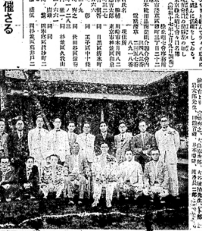
東京昭七會の模様。前列には本報社長が立っており、各界の要人が並んで立っている。背景には大きな横断幕が掲げられている。

陸軍大臣より 感謝状送る 陸軍大臣から感謝状が送られた。陸軍大臣は、本校の発展と教育の向上に貢献したことに感謝を表した。感謝状は、本校の校長に送られた。