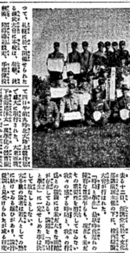
鎌武大會堂々制覇の模様。前列には本報社長が立っており、各界の要人が並んで立っている。背景には大きな横断幕が掲げられている。

蒼空に緑り展ぐ 敢闘の繪巻 鎌武大會堂々制覇 昨日（十四日）午後七時、鎌武大會堂に於て、敢闘の繪巻が開催された。この繪巻は、本市の発展と教育の向上を目的として行われる。繪巻には、各界の要人が出席し、本市の現状と今後の展望について話し合われた。繪巻は午後九時頃に閉幕した。