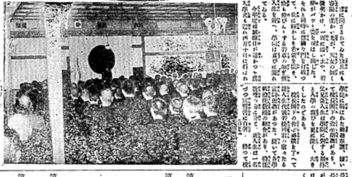
新講堂の陽光に輝く入學式の様子。生徒たちが新築された講堂に集まり、入学式が行われている。