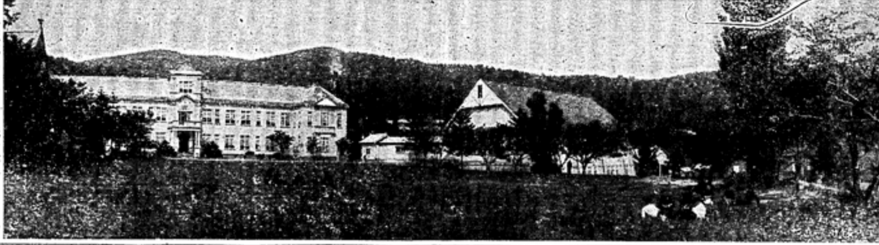
「舊日」 校長室より本校舎を望む