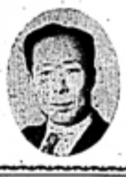
時計店 兼井時計店