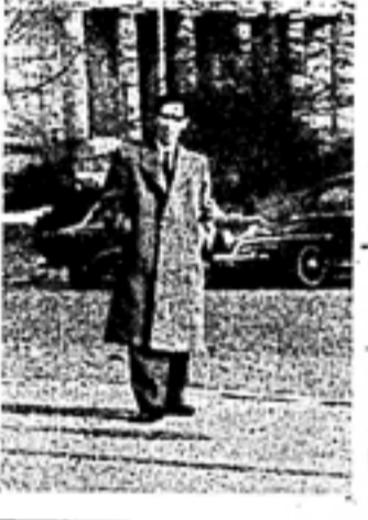
【写真】ニューヨーク街に於ける筆者

第七回学生経営学会より 不完全な研究成果を発表する。そのために、第七回学生経営学会より、不完全な研究成果を発表する。