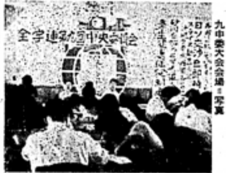
九中委の会議風景。日ノ交渉即時妥結などの決議が行われた。

九中委(第九回日ノ交渉)は、十月三日、小樽市で開かれた。この会議は、日ノ交渉の即時妥結を促すこと、そして、学内機構改革案について意見を述べた。また、学生課の設置問題についても議論が行われた。会議の結果、日ノ交渉の即時妥結を促すこと、そして、学内機構改革案について意見を述べた。また、学生課の設置問題についても議論が行われた。