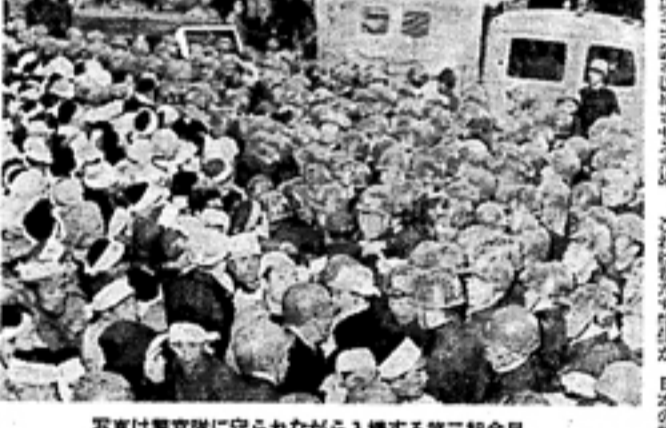
写真は震災後に守られた入構する第二組合員

格決定理論は、再生産力を強化し、国民の生活水準を向上させるための重要な手段である。また、労働力の質を向上させるための教育投資も重要である。格決定理論の実現により、再生産力を強化し、経済の成長を確保できる。