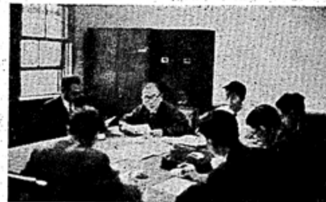
写真はセキ制とカリキヨムを検討する教務委員会

1953年度から(セキ、二年後期) カリ問題は、従来、長らく、その進展を注視して、その動向を、本誌に、詳しく、掲載して、来たが、最近、その進展が、著しく、なつて、来たので、本誌に、その進展を、詳しく、掲載して、来る。