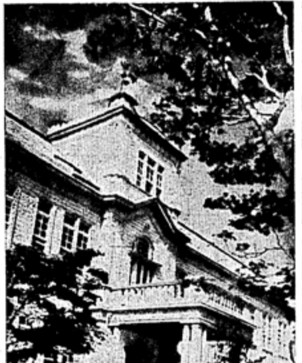
中央と地方の区別 自治会を高め 日常闘争に大きな期待

自治会が改選され、新幹部による闘争が組織上より進められる。今日、自治会が改選される。これは、自治会が学生運動の基盤を築き、その歴史を振り返る必要がある。学生運動は、自治会を擁護し、その基盤を築き、その歴史を振り返る必要がある。学生運動は、自治会を擁護し、その基盤を築き、その歴史を振り返る必要がある。 自治会が改選されることは、学生運動の基盤を築き、その歴史を振り返る必要がある。学生運動は、自治会を擁護し、その基盤を築き、その歴史を振り返る必要がある。