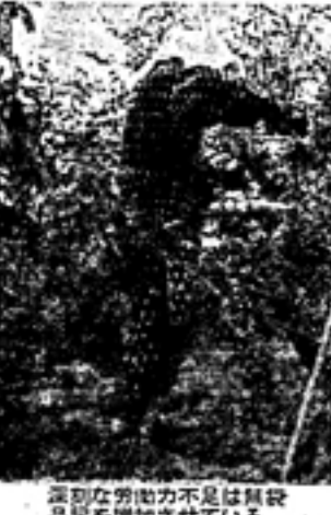
農研青森の活動の様子