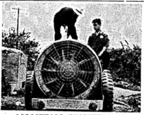
1台300万円余のS・Sは企業経営の1つの指標

導入状況 ▲スピードスプレーヤーの導入状況 ▲共同防除の効果 ▲共同防除の問題点 ▲共同化の裏側