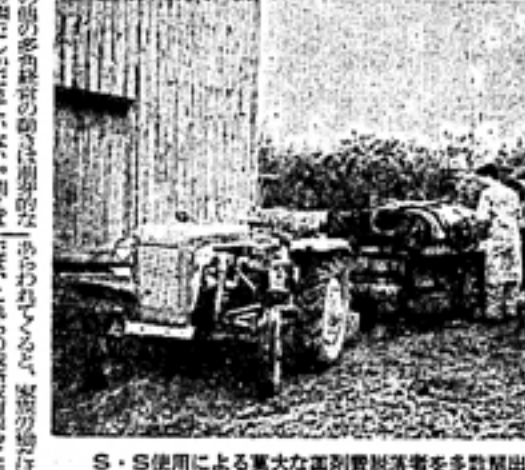
S・S使用による莫大な薬剤削減量を多数届出している

導入状況 ▲スピードスプレーヤーの導入状況 ▲共同防除の効果 ▲共同防除の問題点 ▲共同化の裏側