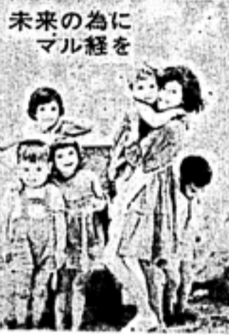
未来のために マル経

「経済研究の数学的方法」は、経済学と数学の接点を探る興味深い試みである。著者は、ソ連の経済動向を背景として、数学的モデルを用いて経済現象を分析している。特に、資源配分や生産効率の問題に焦点を当て、微分方程式や最適化理論を応用している。このアプローチは、従来の定性的な経済学を補完し、より厳密な分析を可能にする。読者は、経済学がどのように数学の力を借りて進歩しているのかを学ぶことができる。