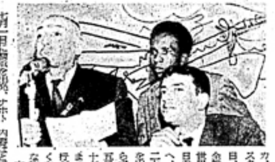
九月十四日、東京の国立代々木競技場で開かれた第17回世界平和大会の会場の様子。

世界平和大会は、第二次世界大戦の終結後、毎年開かれ、人類の平和と友好の精神を鼓舞する重要な国際的行事である。今年、東京で開催された第17回世界平和大会は、その歴史の中で最も重要な意義を帯びたものである。 大会は、9月15日から17日まで、東京の国立代々木競技場で行われ、世界各国から数千人の代表者が参加した。開会式は、厳粛な雰囲気の中で、平和の鐘を鳴らすとともに、世界平和の誓いを立てた。 大会の中心テーマは、「平和と人類の発展」であり、各国代表者は、互いの国や文化の違いを超えて、共通の平和の理想を語り合った。特に、アジア太平洋地域の平和と安定が、世界の平和の鍵であると認識された。 また、大会では、平和の象徴として知られる「平和の鐘」の授けられ、参加者全員が鐘を鳴らすという感動的な場面もあった。この鐘の音は、世界中に平和のメッセージを届けた。 大会の成功は、人類の平和への強い意志と、国際協力の重要性を示している。今後も、このような国際的行事を通じて、世界の平和と発展に貢献していくことが、我々の責務である。