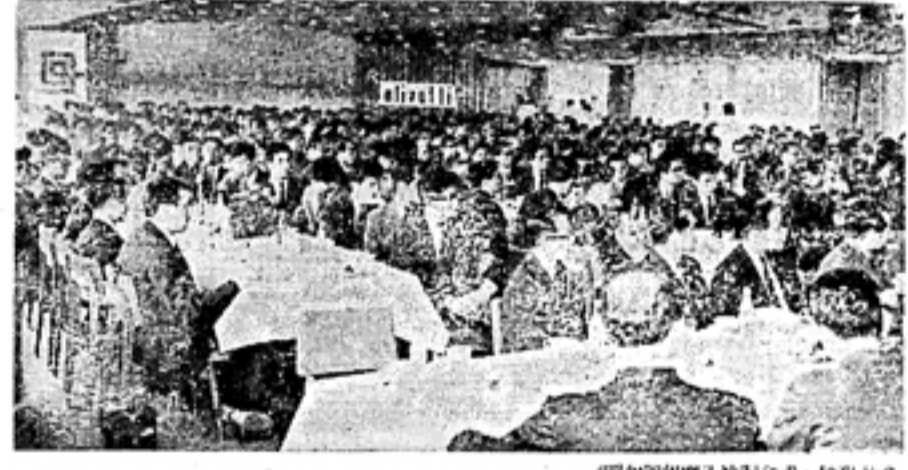
昭和38年度入社式(式・和光)

●オリベッティは、イタリアに九大工場、41支社のほか、世界22か国に同業会社、125箇所に代理店をもつ従業員5万人、資本金600億リラ(350億円)の事務機総合メーカーです。 ●生産機種は、加算機、電動計算機、会計機、電子統計変換機、電子計算機、通信機、各種のマイブライター、スチール製事務用品です。 ●日本オリベッティは、国産品との競合の激しい計算機、会計機の領域で、技術革新に対応して事務の改善、合理化をはかり、能率向上をとりて日本社会の進歩に貢献すべく、去る昭和35年に設立されました。当社は、君と、向上とを旗印に、いま前夜の礎石をきつてつづつあるのです。