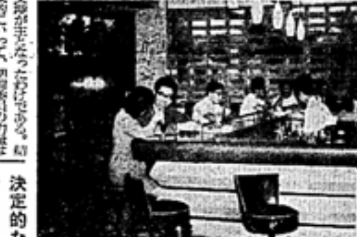
決定的な営業計画

学生個々の生活観の集約は、大学祭を通じて実現される。学生は、自分の生活観を表現し、互いに理解し合う機会を得る。