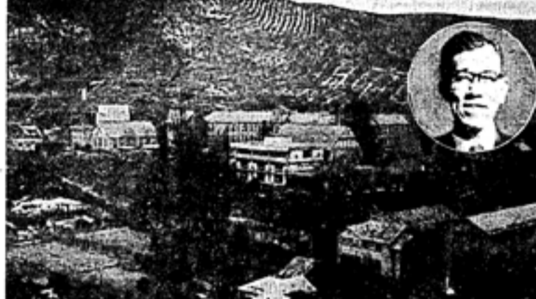
実方新学長と南大会長

大学の自治が基本。教授会の自治が基本。大学の運営は、教授会の自治に基づいて行われるべきである。また、大学の自治は、社会の発展に貢献するために不可欠である。