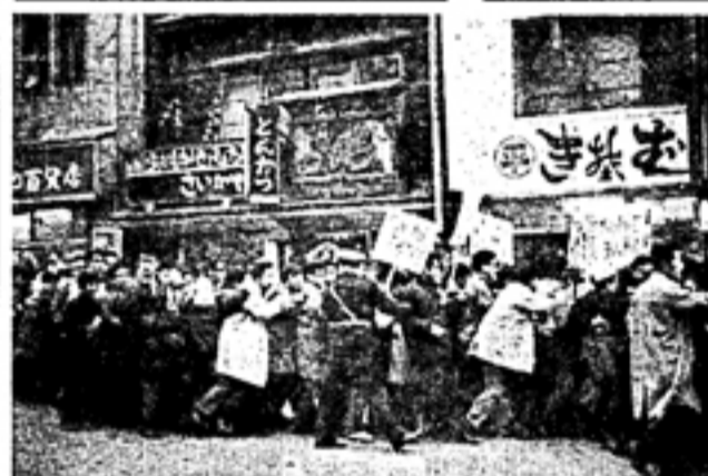
昨年度の米軍第七艦隊小樽寄港反対デモ

全学連再建の展望。全学連は、学生生活の向上と学業の充実を目的として設立された組織である。その再建の展望としては、組織体制の刷新や、活動内容の充実が挙げられる。また、学生自身の意識向上や、社会参加の積極性も重要な要素である。全学連は、学生生活の中心となる組織として再建されるべきである。