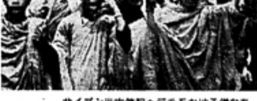
サイゴン米大使館へデモをかける学生たち

市民的不服従は、平和運動の重要な手段の一つである。市民的思考法の限界を克服するためには、市民的不服従が不可欠である。 市民的不服従は、平和運動の持続性を高めるだけでなく、社会全体の意識を高めるにも役立つ。市民的思考法の限界を克服するためには、市民的不服従が不可欠である。