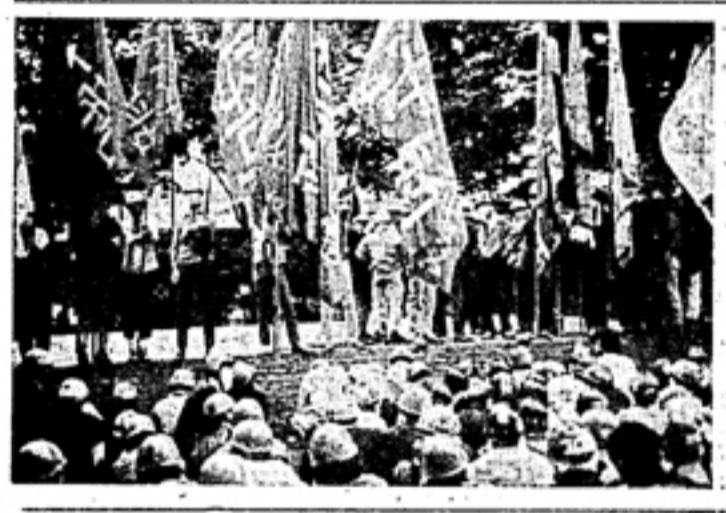
大衆運動の創出を促すために、社会の構造を変革し、個人の意識を高める必要がある。

大衆運動の創出は、社会の発展にとって不可欠な要素である。しかし、現代社会では、大衆運動の創出が難しくなっている。これは、社会の複雑化や個人の意識の高まりによるものである。しかし、我々は、大衆運動の創出を促すために、社会の構造を変革し、個人の意識を高めなければならない。只有这样、社会の発展を促すことができる。