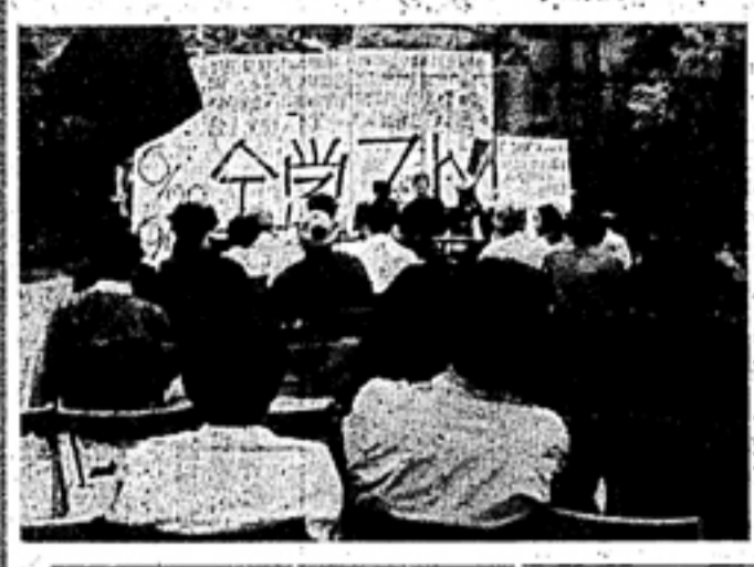
札幌市立大学の学生が中心となり、市内の主要な商業施設や公共施設を占拠した6月23日の斗争活動の様子。

【札幌14日通信】札幌市で、6月23日、学生による大規模な斗争活動が行われた。この斗争は、札幌市立大学の学生が中心となり、市内の主要な商業施設や公共施設を占拠し、市民生活を混乱させた。斗争は、学生たちの要求として、学費の削減や就職支援の強化などが挙げられていた。警察は、斗争活動を抑えようとして、市内に大規模な出動を行った。しかし、学生たちは、警察の武力に屈せず、斗争活動を続けた。この斗争は、札幌市の歴史に大きな刻を刻き、70年代の学生斗争の幕を開いた。