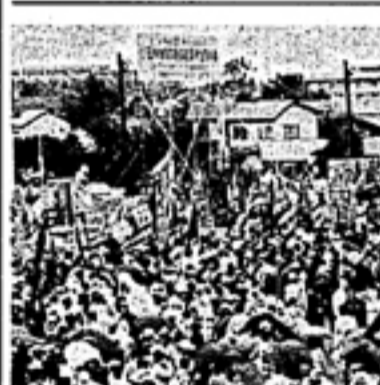
反対集会に参加する学生たち。演習反対のプラカードを掲げている。

この集会は、日米実動演習の中止を求め、日韓問題の解決を促すことを目的とした。集会では、演習反対の理由が説明され、参加者からは演習中止を要求する声が聞かれた。この集会は、日米実動演習の中止を求め、日韓問題の解決を促すことを目的とした。